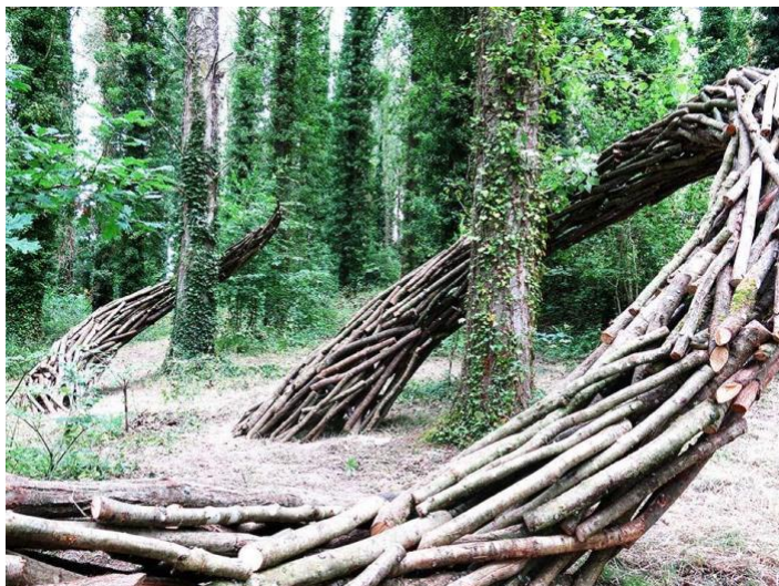
L'art est dans les bois - elapro, juillet 2019